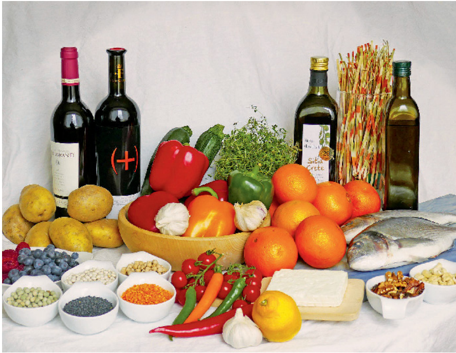
Abb. 1 Die Mittelmeer-Diät. Dazu gehören u.a. Nüsse, Fisch, Olivenöl, Nudeln, Obst, (Schafs-) Käse, Kräuter, Gemüse (Tomaten Paprika, Zucchini, Gurken), Knoblauch, Zitrusfrüchte, Hülsenfrüchte, Beeren und Rotwein.

sen (Mischung aus Mandeln, Haselnüssen und Walnüssen) – im Vergleich zu einer „normalen“, lediglich Fett-reduzierten Diät auf die Morbidität und Mortalität auswirken. Dabei waren die Kalorien der beiden mediterranen Diäten nicht reduziert. Die Patienten wurden den Gruppen randomi-